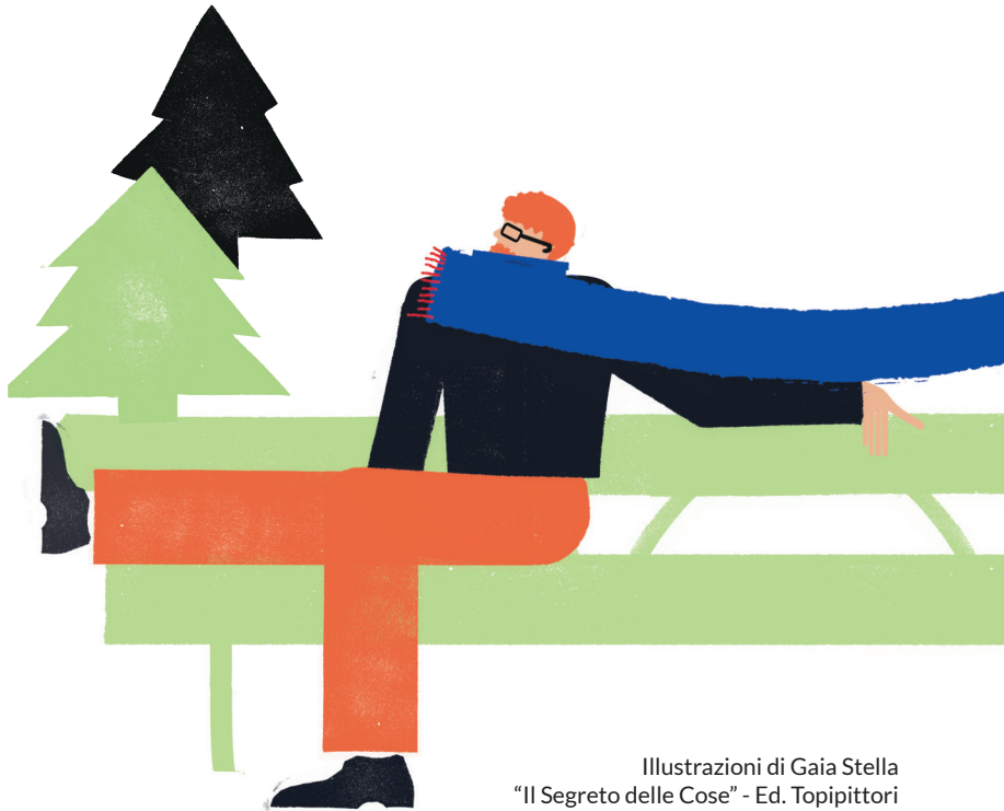
Illustrazioni di Gaia Stella "Il Segreto delle Cose" - Ed. Topipittori